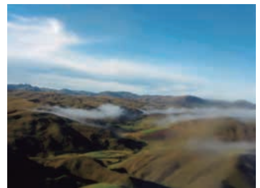
Foto 2. Estribaciones al nororiente de Santander.