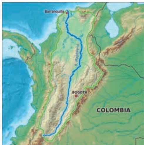
Figura 4. El río Magdalena

exterior, sobre todo en el marco de la globalización—, estimulada por ese río como canal integrador. Pues bien, esa región perfectamente se lee en Colombia —en el sueño de país—.