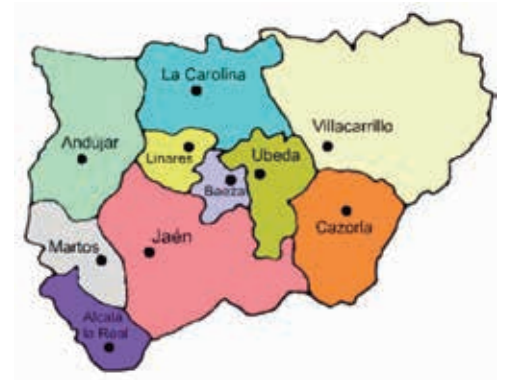
Figura 7. Provincias de Jaén