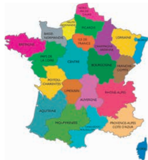
Figura 1. Regiones de Francia

Aunque los pequeños Estados fueron unificados, sus habitantes conservaron sus referentes culturales particulares. Tanta diversidad amenazaba el proyecto de nación francés, por lo cual fue necesario establecer un sistema de gobierno centralista que diera uniformidad al recién creado conjunto. Este sistema progresivamente fue dividiendo el territorio continental —hoy comparable a un hexágono— en arbitrarias unidades para la gestión territorial que no tuvieron en cuenta los tradicionales patriotismos locales, sino que se fundamentaron en las características geográficas homogéneas continuas. Estas divisiones se denominaron generalidades , en tiempos de la monarquía, y departamentos a partir de la Revolución. Como los referentes culturales son muy fuertes, hacia los años ochenta