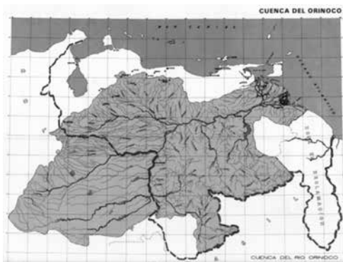
Figura 2. Cuenca del Orinoco

Comprende todos los países y territorios que están o limitan con el mar Caribe. Esencialmente, es una unidad territorial de carácter ambiental, pero precisamente a raíz de sus particularidades geográficas, se constituye simultáneamente como unidad cultural; sin ningún problema reconocemos el talante alegre de los caribeños y es vista como cuna de la música sandunguera. Por otra parte, se ha constituido como unidad económica y de mercado por el intenso tráfico de mercancías a través de sus puertos. Por lo mismo, no solo forman parte de ella la franja de tierra que bordea el mar, sino también todo el país al que está unida y que a través de esta participa en la economía global. El caso de Colombia es claro, pues se reconoce como un país caribeño, aun cuando geográficamente no todo su territorio es tocado por el Caribe.