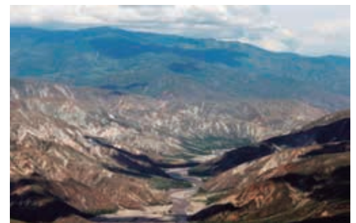
Foto 1. El Cañón del Chicamocha, Santander