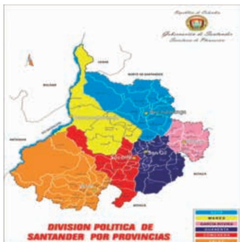
Figura 3. Departamento de Santander y provincia Comunera (en rojo)