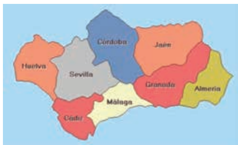
Figura 6. Provincias de Andalucía

Tierra de agrestes montañas —ariscas como ninguna— donde aún resuenan los pasos de la gesta comunera, en que el edicto opresor rompió mujer altanera —símbolo de