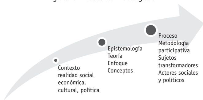
Figura 1. Proceso de investigación

que contemplan: en el primer año, la fase de documentación bibliográfica sobre métodos y metodologías en el diseño y la formulación de diagnósticos sociales para la fundamentación teórico-metodológica del proyecto. En la segunda fase, del segundo año, se planteó la revisión de experiencias novedosas en diagnósticos sectoriales o temáticos en lo social, económico, cultural o político con participación comunitaria e incidencia territorial en Bogotá y otras regiones del país. En el tercer año, la fase tercera de experiencia de formulación y aplicación de diagnóstico participativo en un territorio como experiencia piloto de validación y ajuste de la propuesta. Y para el cuarto y quinto año, fase última del proyecto, poner al servicio de las regiones la aplicación de la metodología con acompañamiento, formación y seguimiento a las poblaciones para su gestión (figura 1).