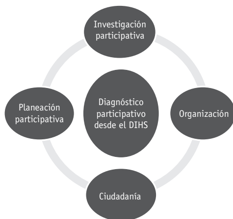
Figura 2. Componentes metodológicos

Dentro de este contexto, los diagnósticos participativos promoverán procesos de organización y participación ciudadana para la planeación del desarrollo y el fortalecimiento de la cultura participativa a partir del interés, la voluntad y la decisión de los sujetos por actuar colectivamente en el logro de unas mejores condiciones de vida que preserve los recursos y perdure en las generaciones futuras (figura 2).