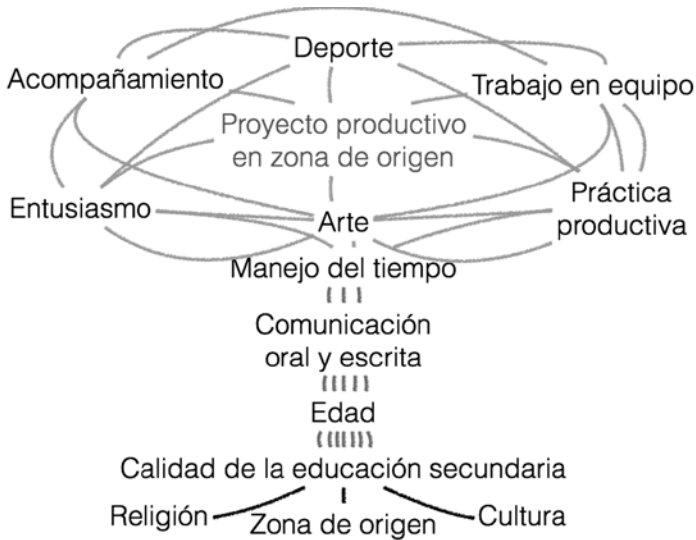
FIGURA 2. ÁRBOL DE FACTORES QUE INTERVIENEN EN EL APRENDIZAJE DEL ESTUDIANTE PRIMER AÑO EN UTOPIÁ