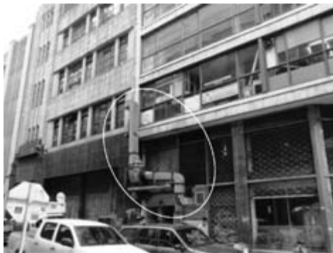
Figura 8. Calle 13, carrera 9

Tuberías utilizadas para la extracción de gases, instaladas por fuera de la edificación y sobrepuestas a la superficie de la fachada (figura 8).