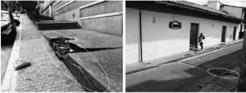
Figura 14. A) calle 11 entre carreras 1 y 2; B) carrera 2, calle 11

Nota: características A: andén afectado por las raíces de un árbol ya retirado; características B: desprendimiento del material de acabado del andén.