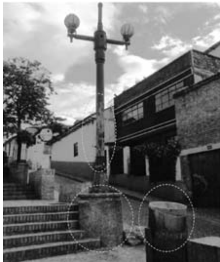
Figura 15. Carrera 2 entre calles 9 y 10

Son objetos propiedad de la ciudad como postes de alumbrado público, bancas, armarios telefónicos y objetos autorizados (mogadores publicitarios), entre otros, que presentan deterioro (figura 15).