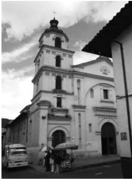
Figura 18. Calle 11, carrera 4

Nota: recipiente para residuos, con bolsas extra por fuera y superficie de piso sin limpieza.