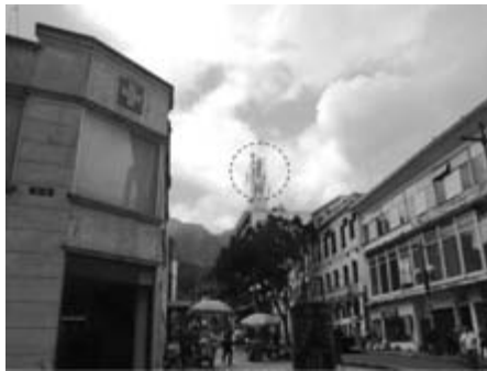
Figura 10. Calle 12, carrera 6

Acumulación de antenas de telecomunicaciones y objetos que cumplen funciones de soporte para estas (figura 10).