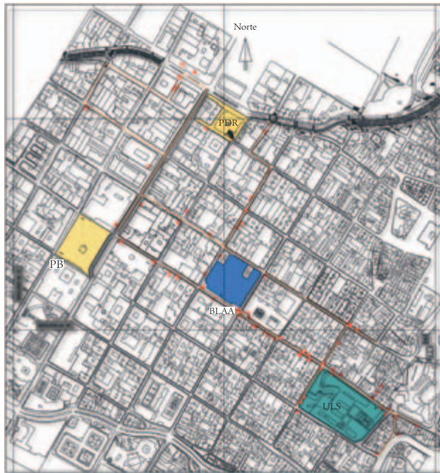
Figura 5. Plano del sector de estudio