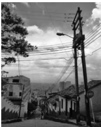
Figura 12. Postes saturados

Nota: poste saturado por cableado aéreo de conducción.