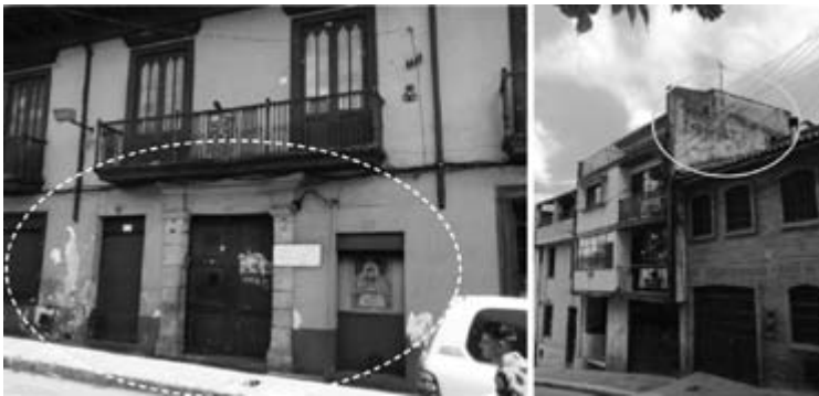
Figura 6. A) calle 11 entre carreras 5 y 6; B) calle 11 entre carreras 1 y 2

Superficies de fachada que presentan un aspecto de deterioro y de suciedad (figuras 6A y 6B).