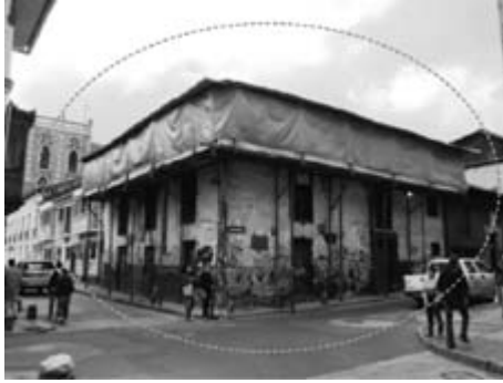
Figura 16. Carrera 4, calle 12

Comprende las obras provisionales y preliminares que se hacen para la intervención de una edificación, pero que por su permanencia y dado lo provisional de los materiales se deterioran (figura 16).