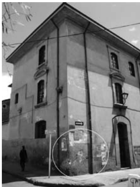
Figura 13. Calle 11, carrera 6

Nota: afiches y propaganda en papel, pegados al muro.