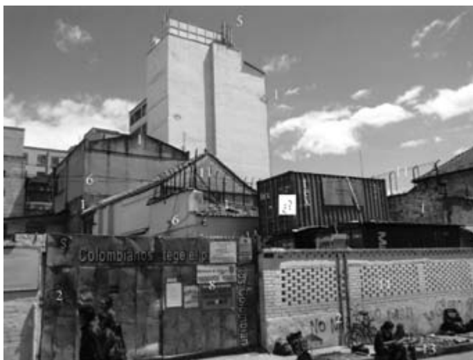
Figura 19. Calle 11 entre carrera 5 y 6, costado suroccidental

Nota: los números corresponden a los elementos típicos identificados en la tabla 3.