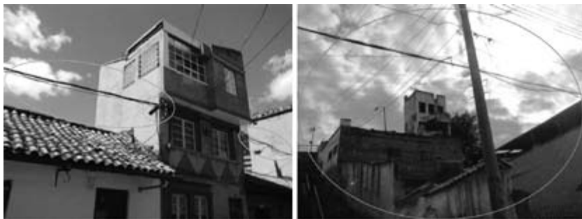
Figura 11. A) calle 13 entre carreras 1 y 2; B) calle 11, carrera 2

Es el cable que simplemente pasa de una edificación a otra, en algunos casos, atraviesa la calzada vehicular (figuras 11A y 11B).