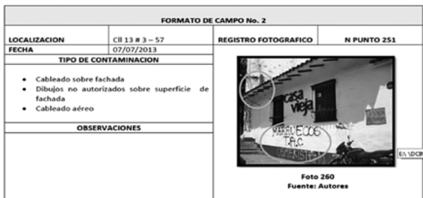
Figura 4. Formato 2, organización del registro fotográfico

En el segundo formato (figura 4), se registran: la imagen (fotografía) del punto; datos complementarios como localización, fecha, número del punto, tipo de contaminación y una primera descripción.