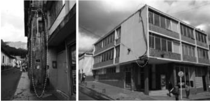
Figura 9. A) Calle 11 entre carreras 3 y 4, B) calle 11, carrera 3

Consiste en diferentes tipos de tuberías de diámetros pequeños que conducen por fuera del muro de la fachada cableados de telefonía, estructurado o energía (figuras 9A y 9B).