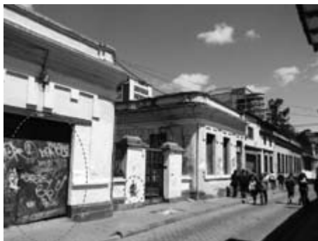
Figura 7. Carrera 2 entre calles 11-12

Mensajes escritos y dibujos no autorizados que por diferentes razones y autores anónimos se elaboran sobre cualquier parte de una fachada (figura 7).