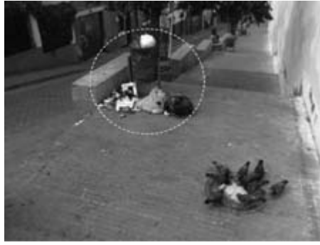
Figura 17. Carrera 2 entre calles 10 y 11

Nota: recipiente para residuos, con bolsas extra por fuera y superficie de piso sin limpieza.