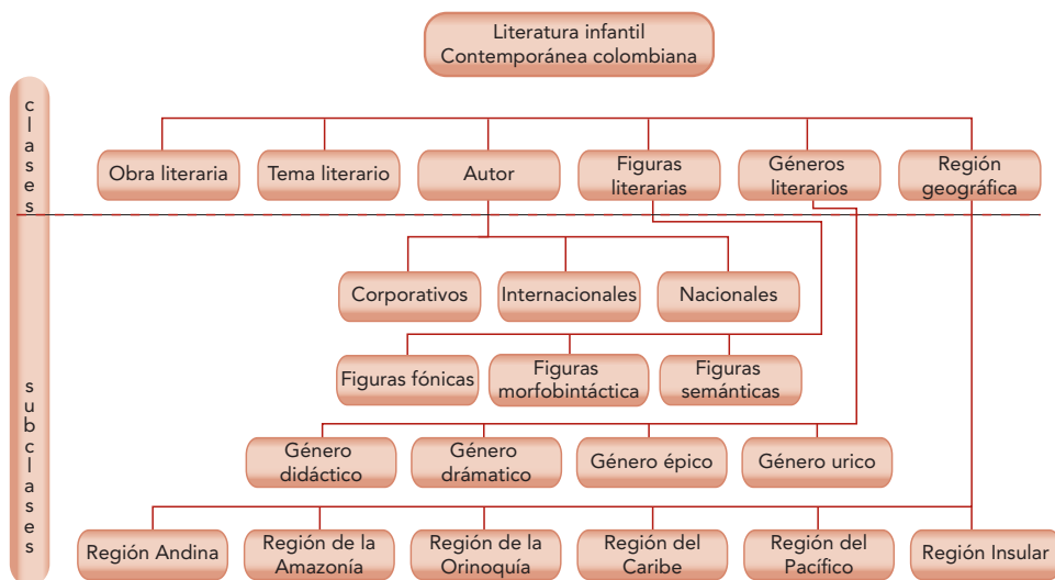
Figura 2. Definición de clases y jerarquía de clases: herencia de conceptos

En la figura 2, se observan cuáles son las clases que se definieron para utilizar dentro de la estructura ontológica, se señalan las subclases correspondientes, a fin de identificar la jerarquía de estas y cuáles serían las subclases que heredarán sus características.