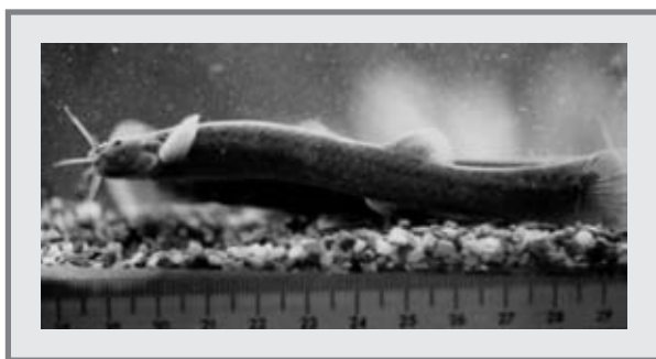
FIGURA 3. EJEMPLAR DE CAPITANEJO, TRICHOMYCTERUS BOGOTENSE .