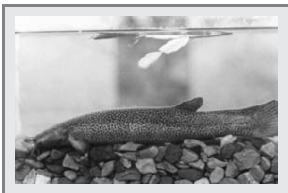
FIGURA 1. EJEMPLAR DE CAPITÁN DE LA SABANA, EREMOPHILUS MUTISII .

El capitán de la sabana ( Eremophilus Mutisii ) es considerado el pez emblemático del altiplano cundiboyacense. Llamado por los indígenas como chimbe , guamujica o pez negro , era parte integral de su dieta alimenticia. Es un bagre de tierra fría, que habita entre los 2.400 y 3.100 msnm, en ambientes lénticos con temperaturas entre 11 y 18 °C (figura 1). Se conocen registros en talla de 250 a 350 g y 40 cm longitud total (LT), por lo cual es considerado el bagre de mayor tamaño existente en cuerpos de aguas frías. Es notoria la ausencia de aletas pélvicas (lo cual lo diferencia del capitanejo) y sus hábitos lo clasifican como un pez bentónico y carnívoro; de reproducción anual, presenta desove en meses de alta precipitación. Su carácter endémico, aspectos de reducción poblacional por pérdida de hábitat y su potencial de cultivo se manifiestan como puntos que han justificado diferentes esfuerzos investigativos. Se le cataloga como especie casi amenazada, según el Libro rojo de peces dulceacuícolas de Colombia (2002).