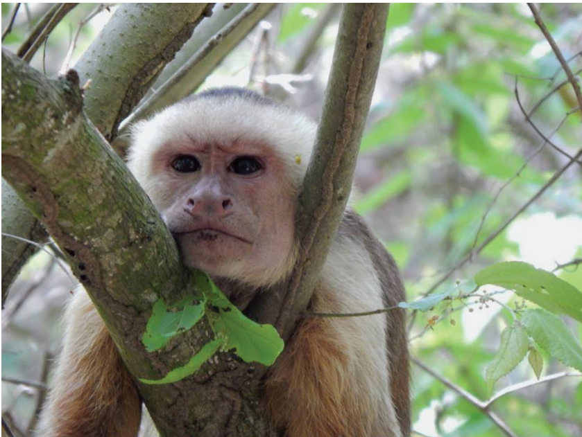
Un pequeño descanso , Camilo Ávila (séptimo semestre)