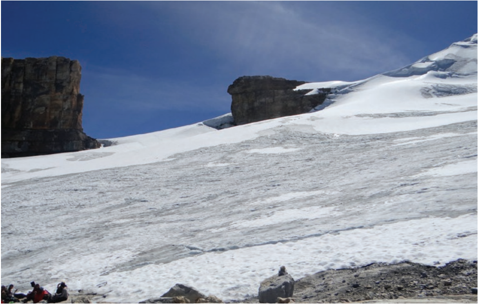
En la inmensidad, Esteban Cardeño (cuarto semestre)