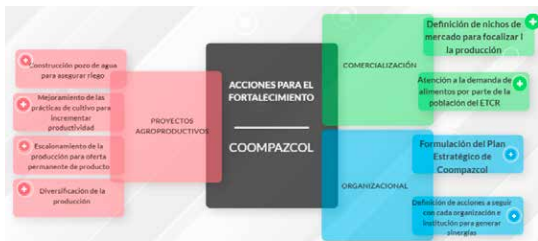
Figura 2. Acciones para el fortalecimiento organizacional de Coompazcol

sus integrantes y el relacionamiento con diferentes organizaciones, tanto públicas como privadas, condiciones que genera las bases para el trabajo y la proyección de la organización. El diagnóstico realizado permitió identificar las acciones para el fortalecimiento de Coompazcol, en los procesos productivos agrícolas, de comercialización y gestión (figura 2).