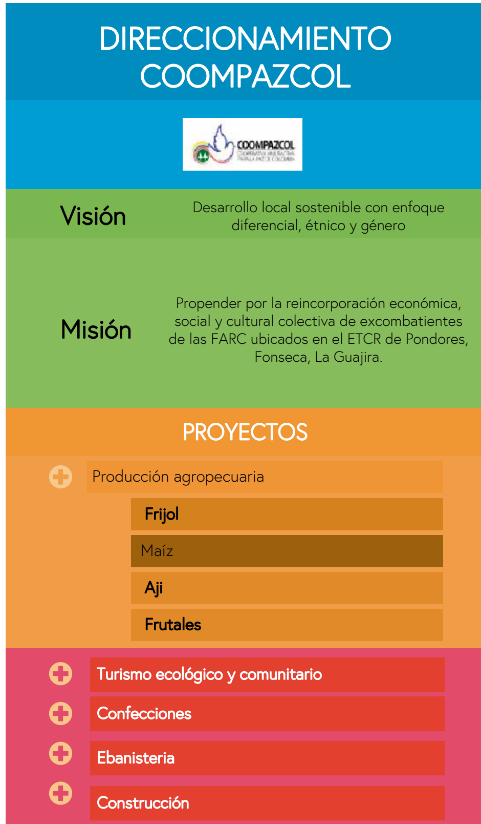
Figura 1. Direccionamiento estratégico y proyectos productivos de Coompazcol