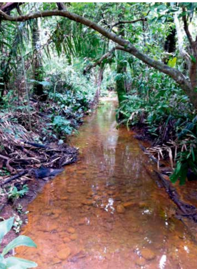
► Bosque de galería ubicado en la Hacienda Matapantano, Universidad de La Salle

Los bosques riparios son corredores biológicos que se encuentran aledaños a cuerpos de agua. En Colombia, un tipo particular de estos sistemas naturales son los denominados bosques de galería , encargados de mantener la biodiversidad y proveer un sinnúmero de servicios ecosistémicos para el bienestar de nuestra sociedad. En nuestro país estos se encuentran localizados principalmente en las regiones Amazónica y Orinoquia. No obstante, a pesar de su importancia, el conocimiento que tenemos de dichos ecosistemas estratégicos es insuficiente y poco valorado.