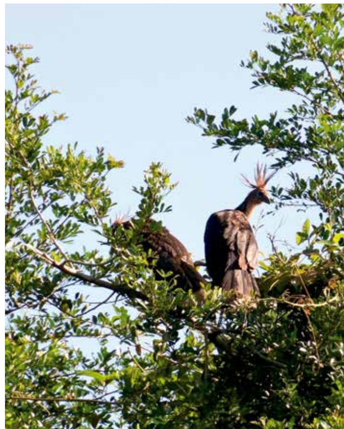
► Pava hedionda ( Opisthocomus hoazin ), presente en la Hacienda Matapantano, Universidad de La Salle

Sin embargo, muchos de los servicios planteados anteriormente no podrían ser viables sin considerar los bosques de galería como hábitat de una gran diversidad de organismos que van desde microorganismos hasta las aves y los mamíferos. Los bosques de galería se consideran corredores biológicos por excelencia y desempeñan un papel fundamental en la conservación de los recursos naturales al ser ejes del equilibrio dinámico. Son entes articuladores entre diferentes ecosistemas, como bosques de piedemonte, sabanas, matas de monte y agroecosistemas. Uno de los ejemplos más claros lo encontramos con las poblaciones de chigüiros ( Hydrochoerus hydrochaeris ) que utilizan el corredor biológico para su desplazamiento y las extensas sabanas y esteros, para proveerse de recursos alimenticios. También