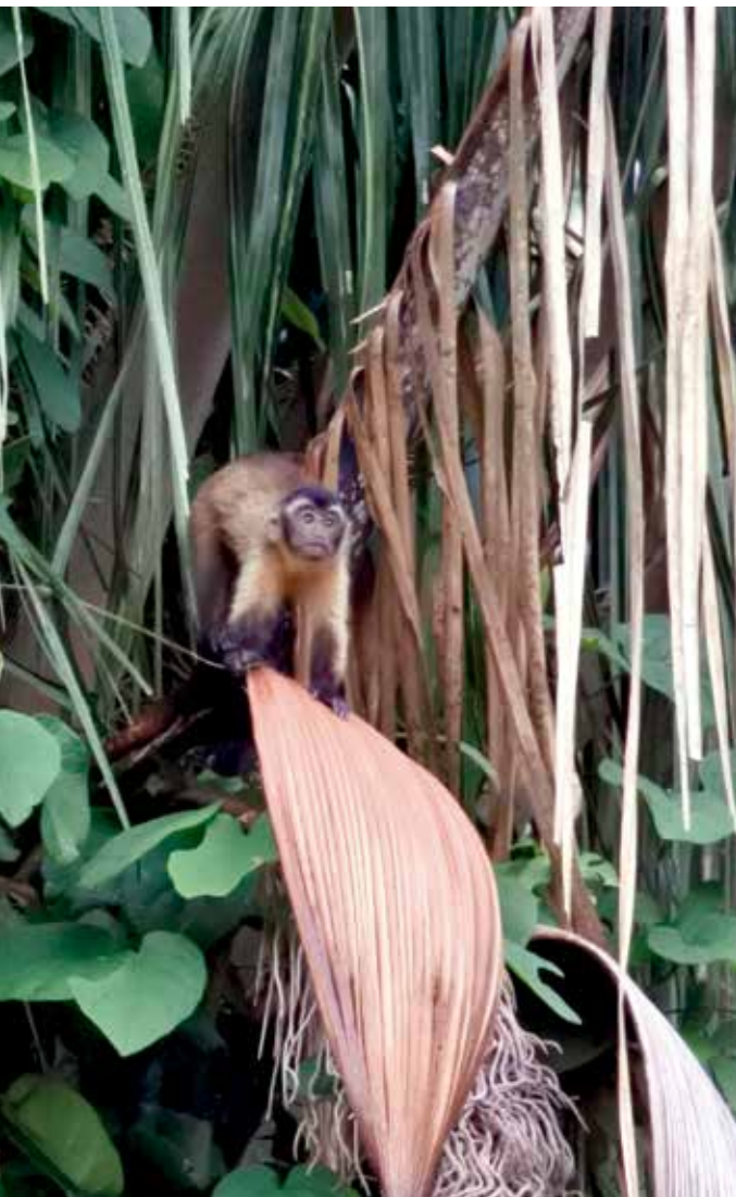
► Mono maicero ( Sapajus apella ) presente en la Hacienda Matapantano, Universidad de La Salle

Gracias a esta visión de los ecosistemas como proveedores de diferentes tipos de recursos reconocemos en los bosques de galería una fuente inagotable de beneficios. Entre estos se destacan los servicios de aprovisionamiento, en los que además de proteger el agua, estos bosques brindan a las comunidades la posibilidad de hacer uso tradicional de gran número de plantas medicinales, como el moriche ( Mauritia flexuosa ) —de la que se consumen sus semillas, se utilizan sus fibras o su madera— o la palma real o de cuesco ( Attalea butyracea ) —de la cual diferentes investigadores de la Universidad Nacional han reportado aproximadamente 36 diferentes usos, siendo los principales la elaboración de vinos y la construcción de viviendas—. En relación con los servicios de regulación, estos bosques se convierten en sumideros de CO 2 , y con ello secuestran el carbono para transformarlo en biomasa expresada en flores, frutos, semilla, hojas y tallos de exuberante vegetación que, posteriormente, es consumida por la fauna que habita en ellos. De esta forma se convierten en ecosistemas con flujos