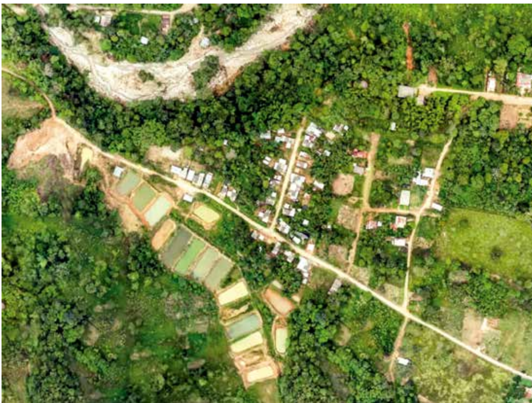
Asentamientos en San Isidro, Municipio de Mocoa.

La propiedad de los inmuebles permite que las personas activen un sentimiento de apropiación del barrio que puede redundar en esfuerzos por mejorar el entorno urbanístico, el acceso a los servicios públicos y demás bienes públicos requeridos para reconstruir las condiciones de vida de la población desplazada. (Opción Legal y Cenac, 2018, p. 170-171)