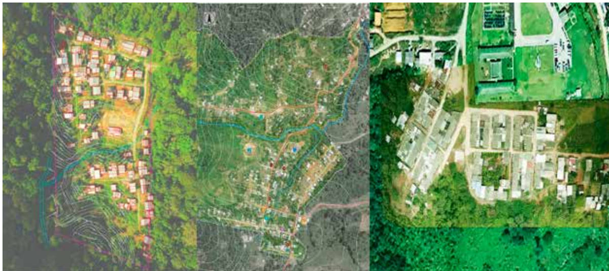
Asentamientos Paraíso, Villa Rosa, Palermo Sur. Municipio de Mocoa. Imagen de dron por GOTAFI, 2018, 2019.

doscientas ochenta familias. Las condiciones de este asentamiento definen un área de vivienda y una zona productiva, en la cual se encuentran cultivos de café y caña. Los equipamientos existentes son el salón comunal, la escuela, la sala de informática y el comedor escolar. Porvenir empezó en el mismo año (2000) y se encuentra en medio de los dos asentamientos anteriormente mencionados. Es el más pequeño, conformado por treinta y nueve familias. Solo poseen el área de vivienda, la caseta y el arroyo como espacios comunitarios que se encuentran dentro de la posible ampliación de la vía a Pitalito.