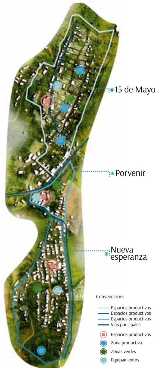
Asentamientos Nueva Esperanza, Porvenir y Quince de Mayo, Municipio de Mocoa. Elaborada por C. Rodríguez, 2017, basada en "Base cartográfica de Colombia" por IGAC, 2019.

(Opción Legal y Cenac, 2018, p.61). Para que se dé un proceso de reparación se debe caracterizar la población, realizar procesos de legalización y regularización con el fin de incluir estos asentamientos en los planes de ordenamiento y garantizar sus derechos económicos, sociales y culturales.