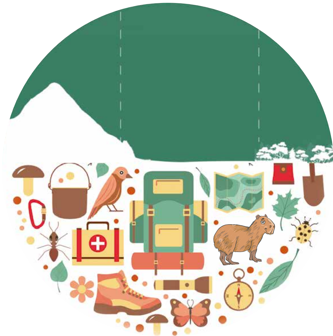
Representación del ecoturismo en el Piedemonte - Llano - Selva.

necesaria a la hora de hablar de paz. Esta reconciliación solo es posible siempre y cuando, todos los colombianos tengamos la disposición para reconocernos en esos territorios, otrora habitados por seres humanos supuestamente distantes y violentos que, no obstante, ahora están dispuestos a compartir y ofrecer sus conocimientos sobre infinidad de lugares sorprendentes.