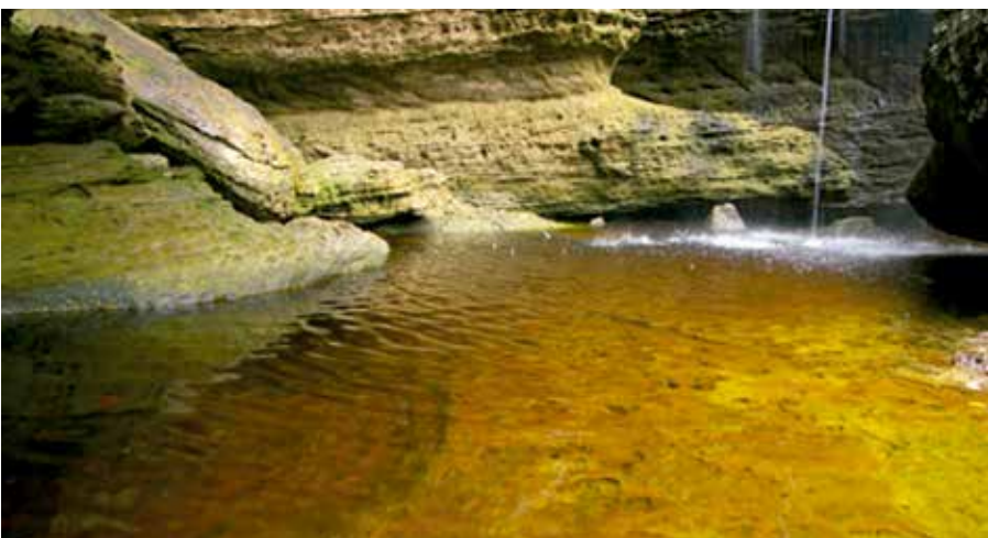
Cascada Las delicias, San José del Guaviare.