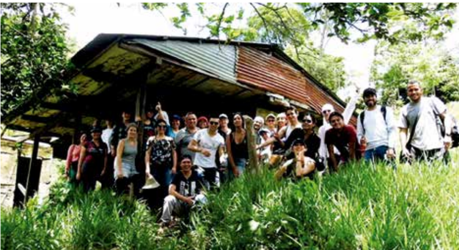
Workshop Sustainable Urbanism (Taller de urbanismo sostenible) 2018, Monterrey, Casanare.