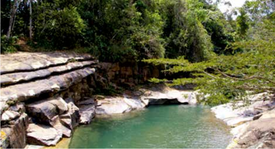
Piscinas del Güejar, Lejanías, Meta.