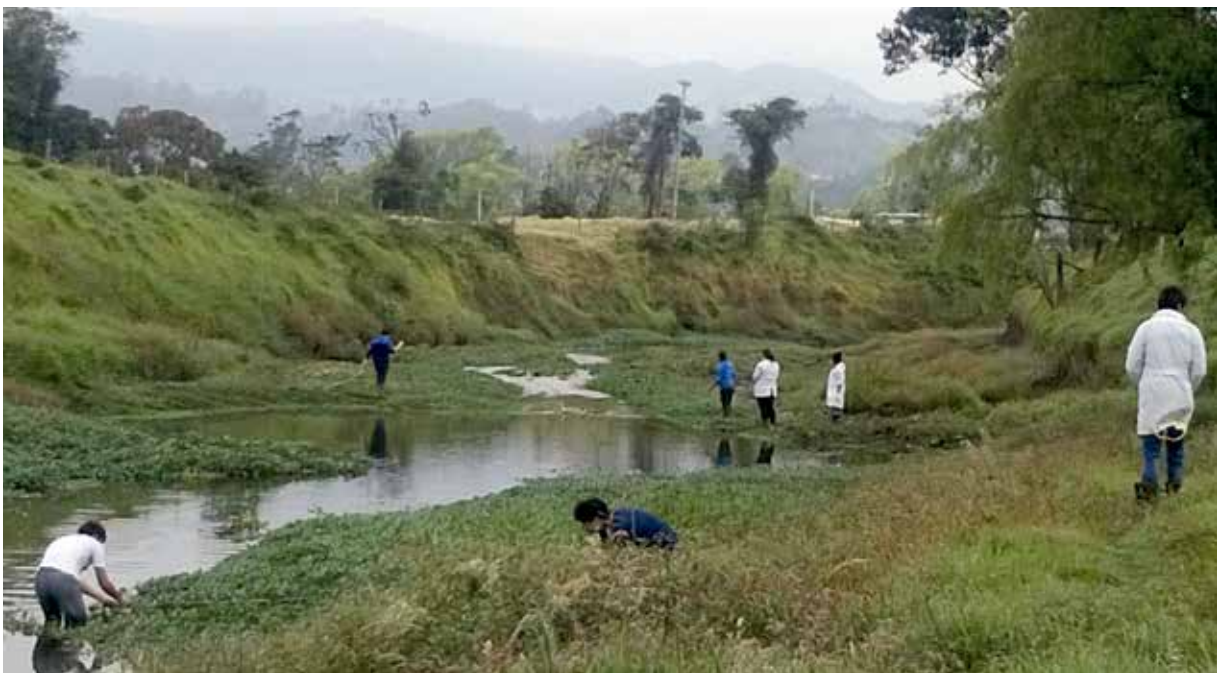
Estudio en cuenca.

Teniendo en cuenta los preceptos del Ministerio de Ambiente y Desarrollo Sostenible, (Minambiente, 2019) se requiere del estudio de la cuenca como una unidad adecuada para la planificación ambiental del territorio, desde los procesos de coordinación y cooperación de distintos y diversos actores sociales, sectoriales e institucionales que participan en su gestión, con el fin de evitar que el agua y sus dinámicas se conviertan en amenazas para las comunidades, y garantizar la integridad y diversidad de los ecosistemas, en aras de asegurar la oferta hídrica y los servicios ambientales.