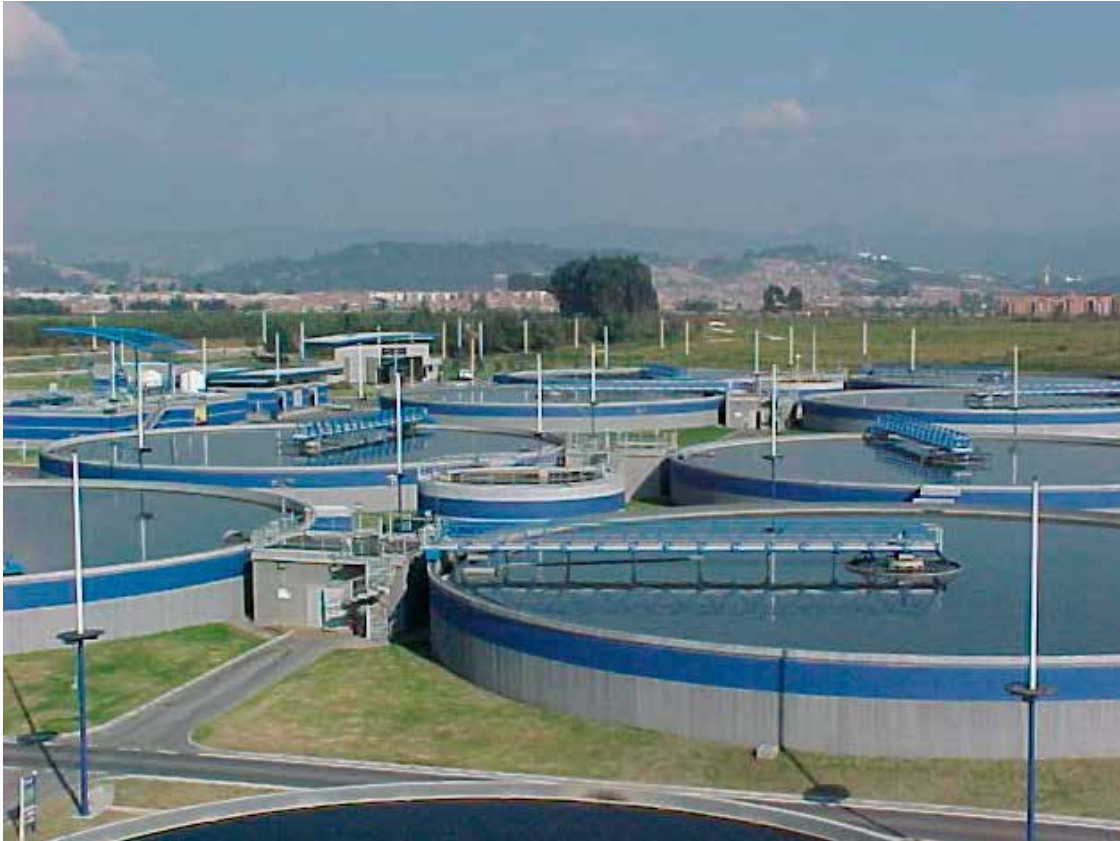
Sistema de tratamiento de aguas.

Es de anotar que precisamente por un mal manejo de las cuencas, y por ende, de la gobernanza del agua, tenemos déficits en muchos municipios y contaminación causada por el mal manejo. Si el ingeniero entiende el origen del agua y cómo ha de retornar al mismo, podrá pensar en soluciones integrales con miras sostenibles.