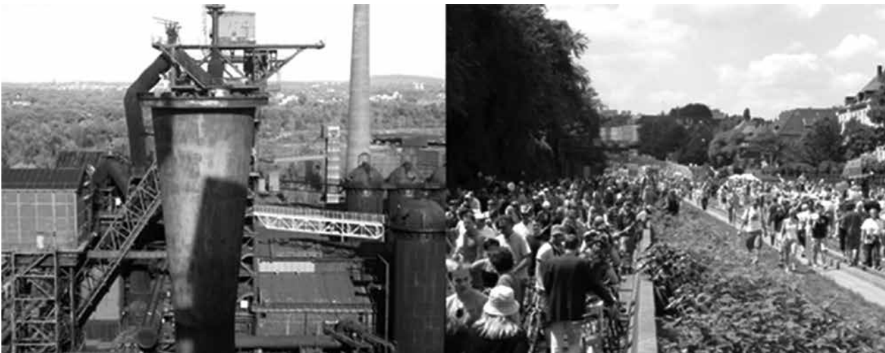
Foto 3. Landschaftspark Duisburg-Nord, Autopista A40, julio 2010 Fuente: Martin Hoelscher (2010).

La percepción de los proyectos de IBA Emscher Park y de Ruhr 2010 ilumina la identificación de toda la región con la transformación postindustrial. Pero esto no incluye la participación de los ciudadanos en el proceso de las decisiones políticas. Había algunas inquietudes de parte de la ciudadanía, especialmente con la implementación de los proyectos de la IBA, pero en general hace falta destacar que los dos eventos no se implementaron con participación. Esta, más que todo,