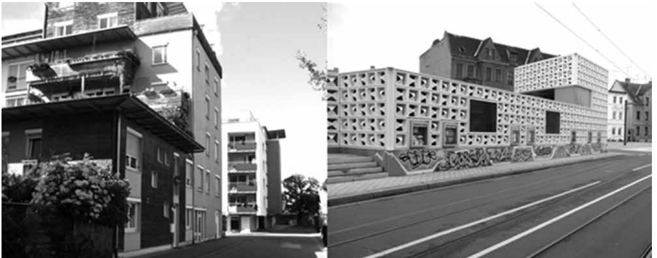
Foto 6. Tübingen-Südstadt, Magdeburg-Salbkke

Hasta la identidad regional se puede constituir con procesos participativos. Regionale 2010 , un programa de desarrollo en la región de Colonia financiado por el Estado de Nordrhein-Westfalen, había desarrollado unos cincuenta proyectos impresionantes en toda la región, más que todo generando sinergias entre unas grandes empresas químicas y petroleras y el sector público. Pero faltaban ideas de cómo promover la identidad regional. Por fin educaron a unos cien jóvenes para que se dedicaran al turismo local y regional. Recibieron documentos que les permitieron llevar el título Regioguide , y desde entonces están responsables de explicar a los visitantes, y a los mismos habitantes, la historia regional y las visiones para el futuro.