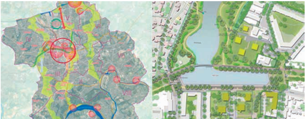
Foto 5. ESSEN.Neue Wege zum Wasser , proyecto Niederfeldsee

Con esto llegamos de nuevo a la formación de la identidad local. La mayoría de los proyectos del programa ESSEN.Neue Wege zum Wasser se encuentra en los barrios que desde hace décadas no participaban en el desarrollo urbano. Así, el programa les da la visión común de un medio ambiente mejor que antes. Proyectos como el Niederfeldsee , un depósito de retención para un afluente del río Emscher, y las nuevas habitaciones en sus orillas contribuyen a la transformación social del barrio de Altendorf. La laguna artificial le da los espacios públicos atractivos que antes no tenía. Dentro de un contexto de viviendas sociales de los años cincuenta una cooperativa municipal de viviendas construye más de sesenta habitaciones nuevas, sobre todo de clase media. Al final, Altendorf habrá perdido su estigma social tanto como el espacial.