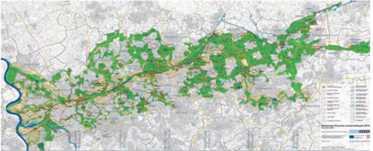
Foto 2. Masterplan Emscher Landschaftspark 2010