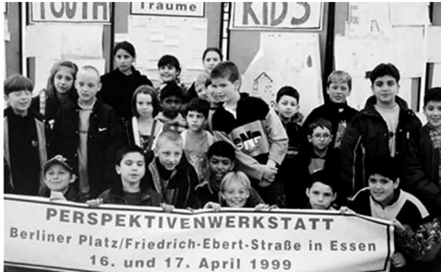
Foto 4. Essen, Perspektivenwerkstatt Berliner Platz

ideas cruciales. Dos años después del workshop los representantes de los vecinos se retiraron del consejo que acompañaba el proyecto. Manifestaron que se habían perdido todos los impulsos para el desarrollo del área que antes surgían del workshop .